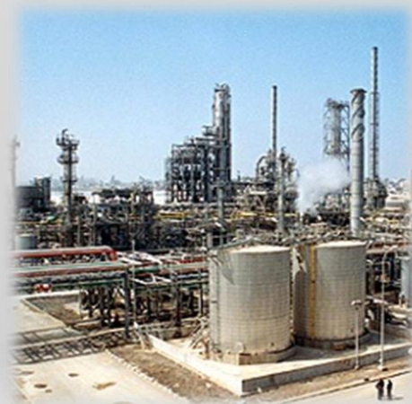
COMPLEJO DE MAXIMIZACION DE GAS OIL – AMOC (EGIPTO)