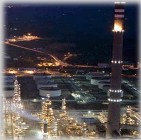
REFINERÍA DE PETRONOR (ESPAÑA)