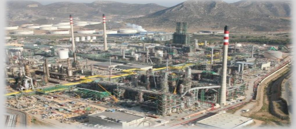
REFINERÍA DE REPSOL- CARTAGENA (ESPAÑA)