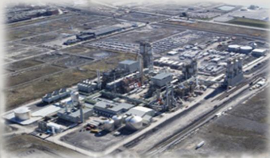
PLANTA PETROQUÍMICA- CEPESA (CANADA)