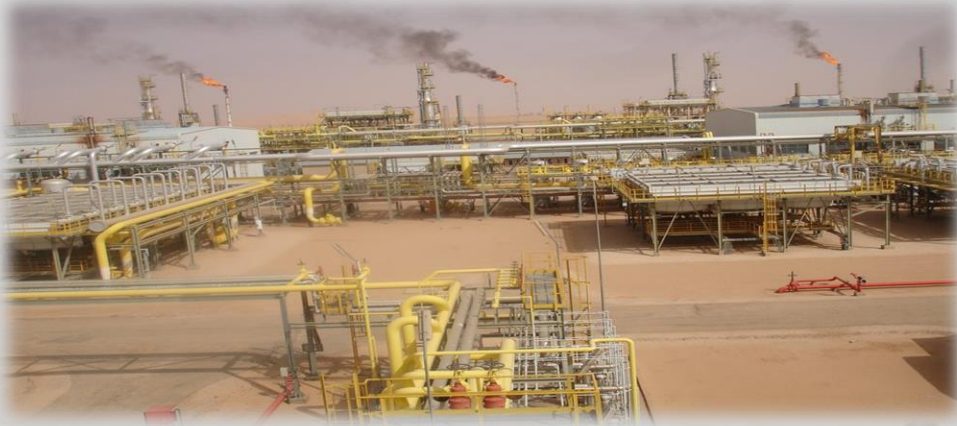
PLANTA DE TRATAMIENTO DE GAS- RHOURE NOUSS (ARGELIA)