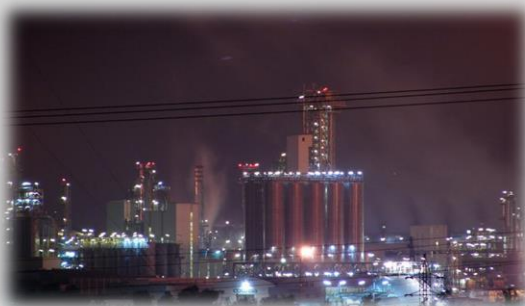
PLANTA DE ESTIRENO- REPSOL QUIMICA (ESPAÑA)