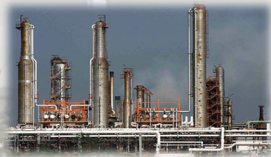
REFINERÍA LAZARO CARDENAS - PEMEX (MEXICO)