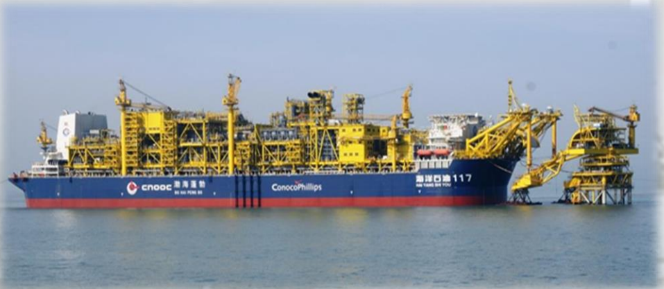
SEIS PLATAFORMAS + FPSO – BOHAI (CHINA)